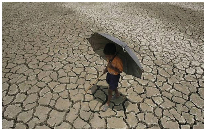
Die Erwärmung wird vor allem bereits arme Bevölkerungen am härtesten treffen: Ernteausfälle können in Gebieten z.B. in Afrika zu unzähligen Toten führen. Die Kluft zwischen arm und reich droht noch weiter aufzugehen.

Diese Ungerechtigkeit sollte sich daher auch in den Massnahmen zeigen. Die drohende Krise haben vor allem jene zu berappen, welche seit Jahrhunderten vom CO 2 -Ausstoss profitiert haben. Und Unterstützung gegen Klimakatastrophen benötigen die Wellblech--Favelas und nicht die Paläste an der Goldküste am Zürisee.