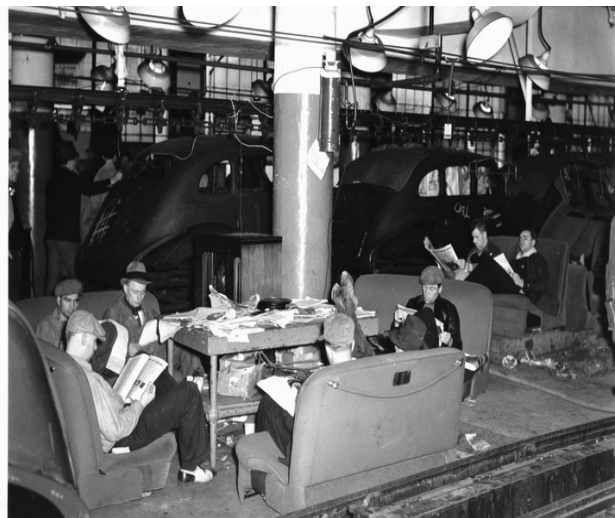
Der Sitzstreik 1937 bei General Motors löste ein erstarken der Gewerkschaften und viele weitere Arbeitskämpfe aus. Durch diese Kämpfe und dem zweiten Weltkrieg kamen die Bosse immer schneller an den Verhandlungstisch und auch die Regierung verabschiedete griffigere (Arbeits-)Gesetze

Auch wenn der NLRA einen grossen Beitrag zur Institutionalisierung von Tarifverträgen leistete, wurde bis zum Zweiten Weltkrieg 5 die direkte Abrech-