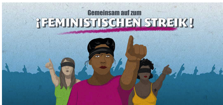
Mobilisierung für den feministischen Streik am 8. März in Deutschland. Das Bild bezieht sich auf die Proteste in Chile. Die Performance „El Violador eres tú“ auf deutsch „der Vergewaltiger bist du“ ging um die Welt.

fähigkeit haben, zeigen nicht zuletzt verschiedene Vertragsverhandlungen. Es trifft einen Nerv der Zeit, wenn neben Lohnforderungen auch Forderungen zu Arbeitszeit und Arbeitsbedingungen gestellt werden. Die Medien zeigen grosses Interesse, und Umfragen zeigen, dass – vor die Wahl zwischen Geld oder Zeit gestellt, verstärkt die Option „freie Tage“ gewählt wird.